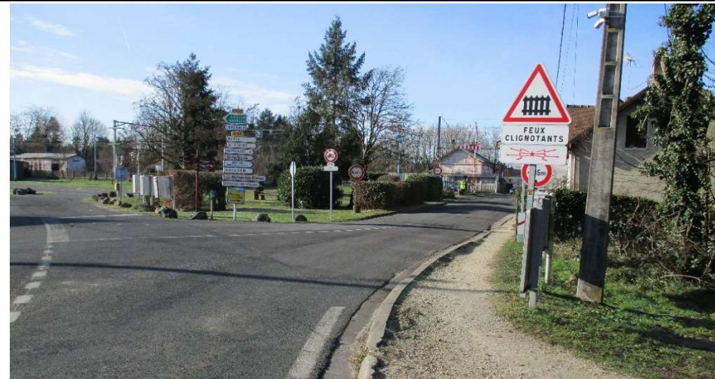
Approche du PN depuis le centre de Nouan (RD2020).