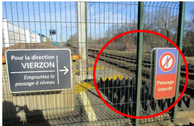
Accès aux quais dissuadé le long de la voie ferrée.