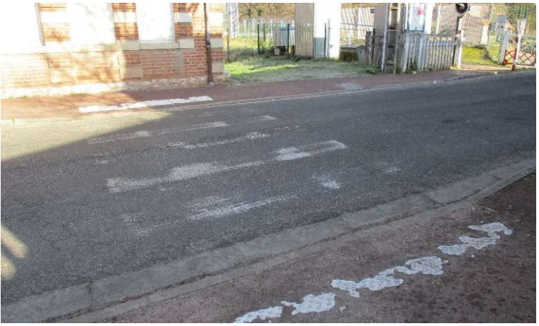
Passage piéton côté Blois partiellement effacé.