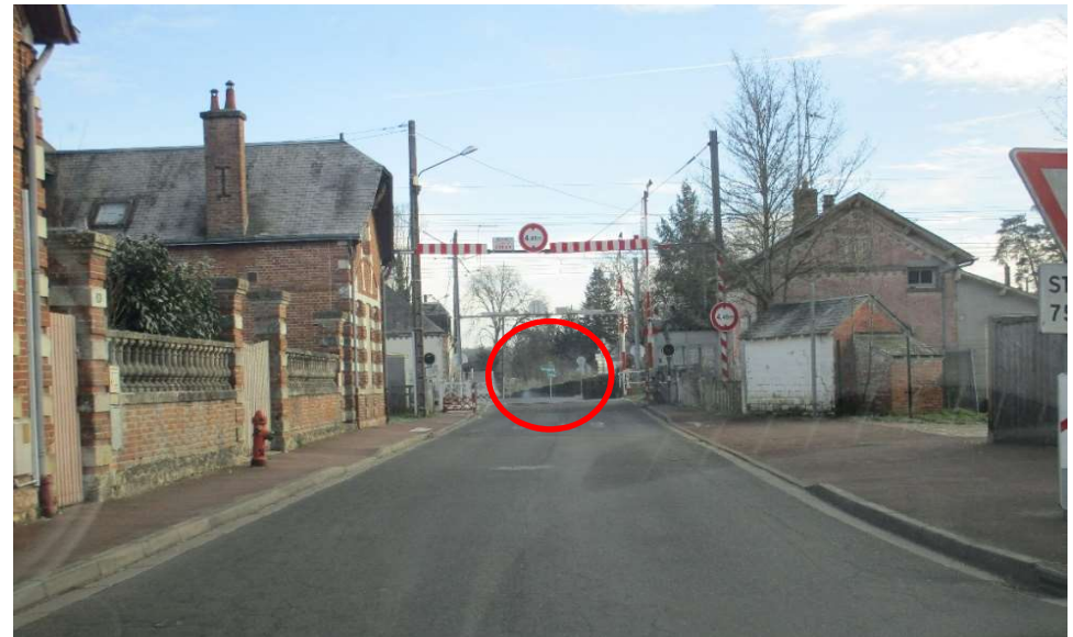
Le PN est identifié grâce au portique. La signalisation directionnelle au carrefour avec la RD2020 est peu perceptible.