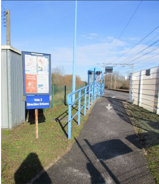
Accès aux voies côté Blois.