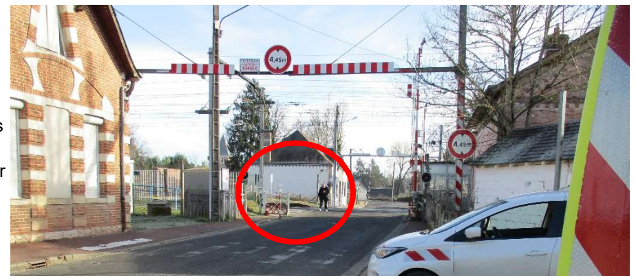
Les piétons n'utilisent pas les portillons pour traverser le PN.