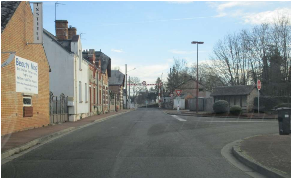
Approche depuis Blois. Présence d'un carrefour en T avec STOP, point de tri et abri bus sur trottoir à proximité immédiate du PN.