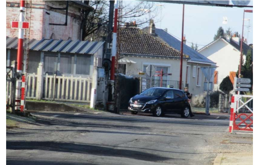
Stationnement sur trottoir observé de part et d'autre du PN.