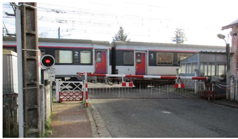
Barrière abaissée et signal lumineux allumé au passage d'un train.