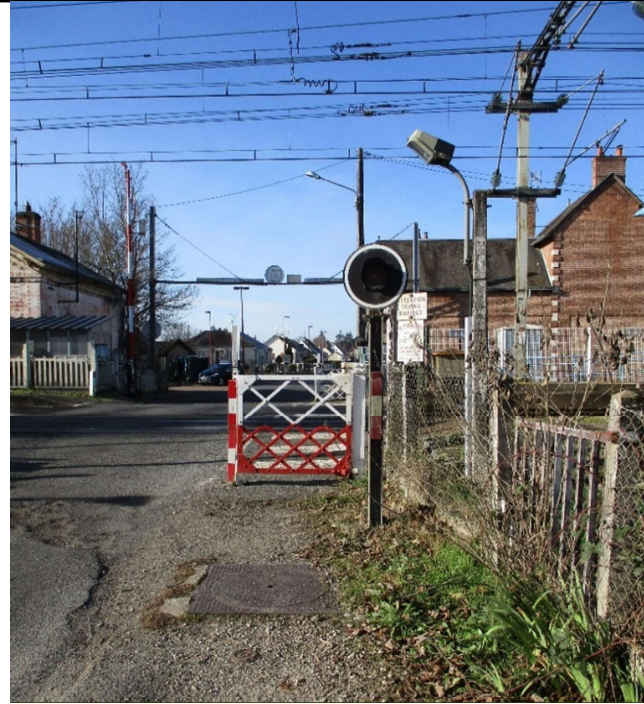
Cheminement piéton depuis Nouan, sur accotement en mauvais état.