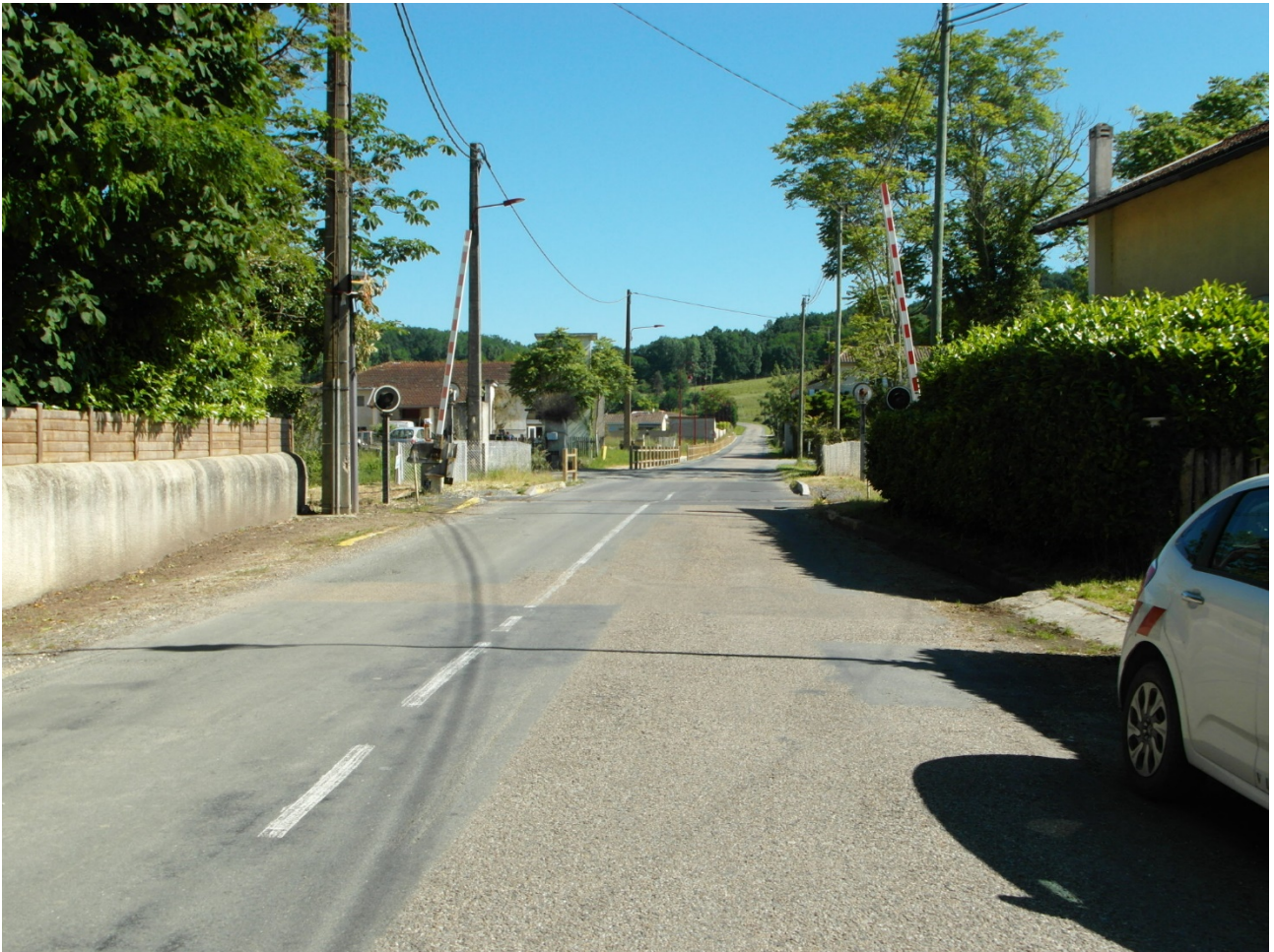
PN381 sens 2